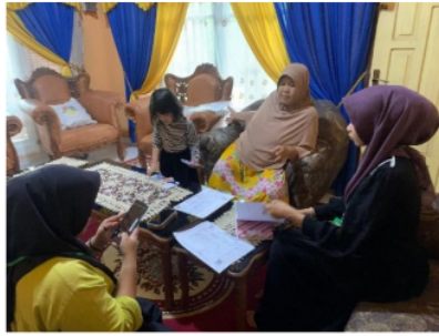
Gambar 2. Pendataan UMKM