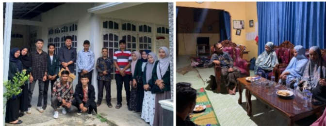
Gambar 1. Pertemuan dengan Kepala Desa

Pada tahap ini tim pengabdian melakukan pertemuan dengan Kepala Desa terkait Program Kerja serta permasalahan yang ada di desa.