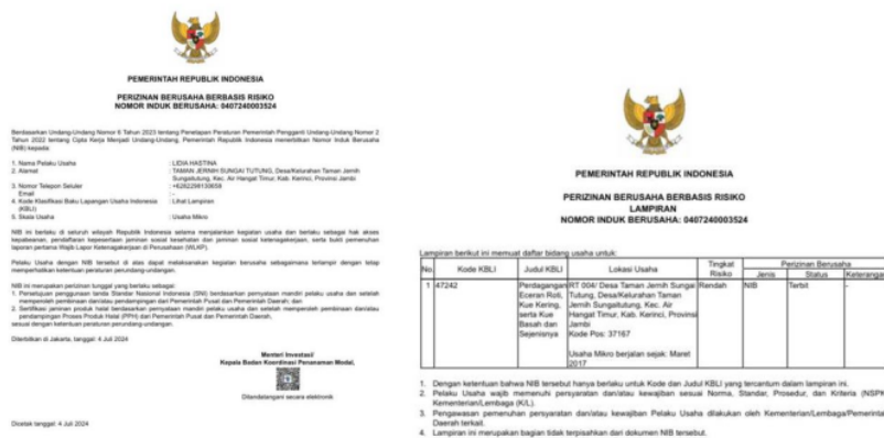
Gambar 4. Nomor Induk Berusaha (NIB)

Format izin usaha telah terisi dengan baik dan benar, maka pelaku usaha akan diarahkan untuk melihat hasil entry -nya. Validasi data dipelakukan untuk memastikan kebenarannya melalui preview darft dan dapat melihat darft NIB yang diajukan. Tahap akhir proses aplikasi OSS, mengarahkan pelaku usaha untuk menekan tombol “proses NIB”, maka selanjutny akan mendapatkan surat izin usaha dan NIB yang diajukan.