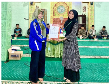
Gambar 5. Penyerahan sertifikat NIB

Penyerahan surat izin dilaksanakan di Mesjid Desa Taman Jernih Sungai Tutung bersama Kepala Desa dan seluruh masyarakat desa.