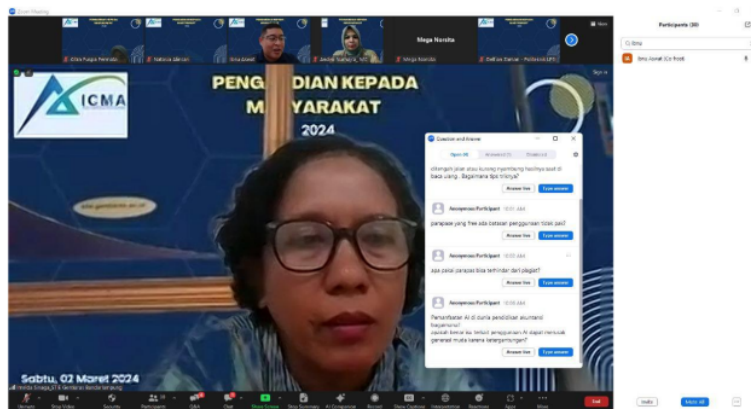
Gambar 2. Suasana Kegiatan