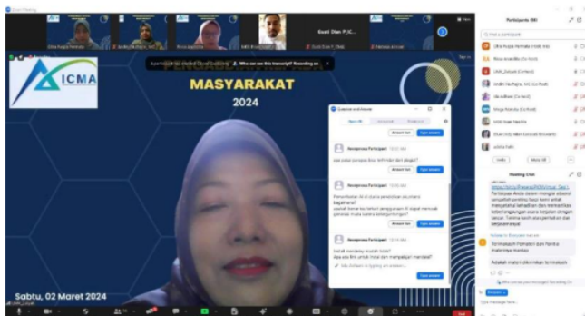
Gambar 3. Sesi Diskusi Bersama Peserta