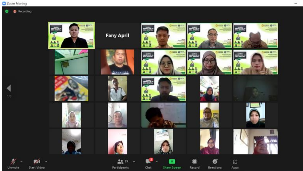
Gambar 3. Peserta PKM Online