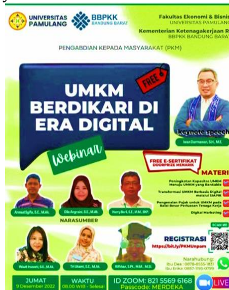
Gambar 1. Sosialisasi PKM di Instagram