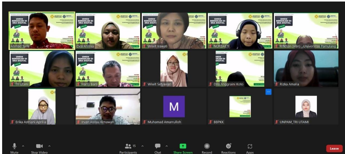
Gambar 1 Tahap Perencanaan Koordinasi dengan Pihak BBPKK

diupayakan agar kegiatan PKM dapat efektif dan efisien mengingat waktu pelaksanaan melalui zoom dan terbatas.