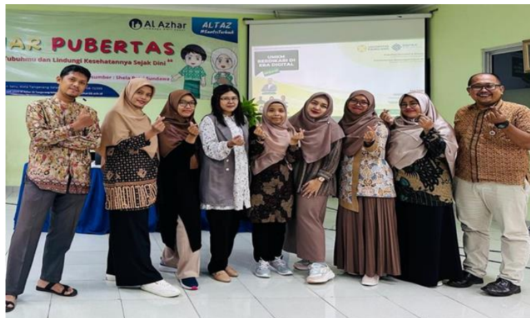
Gambar 2. Foto Dosen PKM dan sebagian peserta luring

Berbagi pengetahuan dan ketrampilan dalam menghitung, menyetorkan dan melaporkan pajak UMKM dilakukan dengan memberikan contoh-contoh perhitungan sederhana terhadap pajak UMKM maupun pajak orang pribadi. Masalah yang terjadi biasanya adalah adanya ketidakteraturan UMKM dalam melakukan pencatatan atau pembukuan yang menjadi dasar perhitungan pajak, (Erion & Harun, 2021). Sistem pemungutan pajak di Indonesia yang menganut sistem self assessment dimana wajib pajak harus menghitung, menyetor, dan melaporkan pajaknya sendiri akan membuat wajib pajak harus mengerti aspek perpajakan untuk dirinya sendiri maupun untuk usahanya.