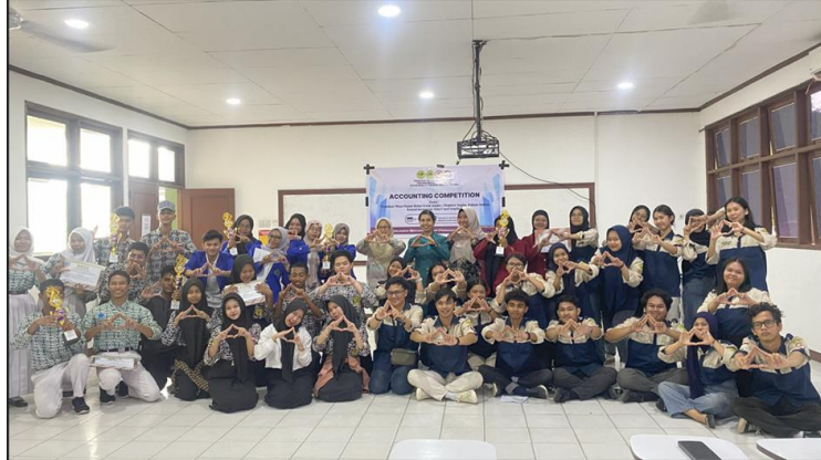
Gambar 5. Foto Bersama Peserta dan Panitia Accounting Competition Fakultas Ekonomi dan Bisnis Universitas 17 Agustus 1945 Samarinda