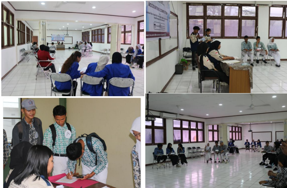
Gambar 6. Dokumentasi Pelaksanaan Accounting Competition Fakultas Ekonomi dan Bisnis Universitas 17 Agustus 1945 Samarinda