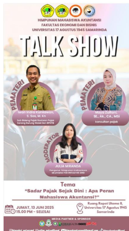
Gambar 1. Penyebaran Informasi Talkshow dengan Tema : “Sadar Pajak Sejak Dini: Apa Peran Mahasiswa Akuntansi?”